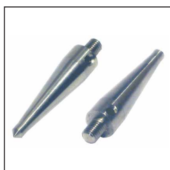
Pistolenfuß 1 (3-er Set)